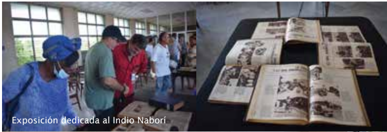
Exposición dedicada al Indio Naborí

De las grabaciones escuchadas ese día, resaltan los poemas y décimas «Desde la ciudad», «La fuga del ángel», «Amor a cántaros», «Amor es el todo», «Un flechero enano», «Canto a la décima» y «Primer desnudo de mujer», entre otros que forman parte de este valiosísimo fondo de la BNCJM.