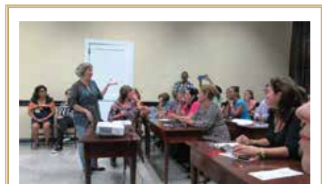
Debates en la Jornada Científico-Bibliotecaria, año 2018

El próximo mes de octubre se celebrará en nuestra institución la IV Jornada Científico-Bibliotecaria, con el propósito de intercambiar experiencias laborales y socializar los resultados de las investigaciones realizadas por un grupo de especialistas e investigadores de la Biblioteca Nacional. Nos ha quedado la agradable huella del último encuentro, efectuado en 2018, en el que se presentaron ponencias que despertaron el interés de los asistentes y donde se apreció una notable participación de trabajadores jóvenes.